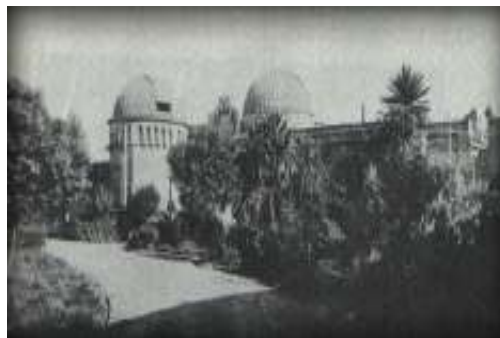
El observatorio en la Quinta Normal a fines del siglo pasado.

Este era el tipo de programa para el cual habían sido diseñados los instrumentos del Observatorio y Moesta lo llevó a cabo con vigor. Entre agosto y comienzos de noviembre de 1862, él y sus dos ayudantes observaron Marte con el círculo meridiano durante 50 noches y con el ecuatorial en 34 noches, desde la Quinta Normal.